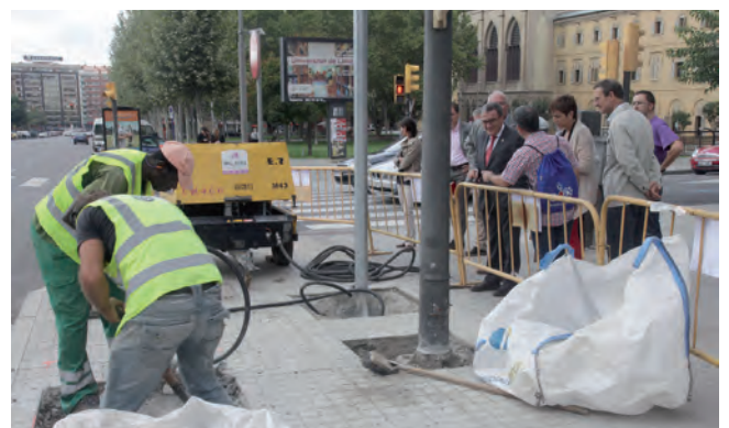
Obres per adequar un carril bici a la Rambla d'Aragó.

a la Rambla d'Aragó i Lluís Companys, la millora de la connexió del barri del Secà de Sant Pere amb Balàfia a través de l'avinguda de Torre Vicenç, la millora i l'ampliació del carril bici a l'avinguda Estudi General aprofitant la reurbanització d'aquest vial, i la implantació de carril bici a l'avinguda de València. •••