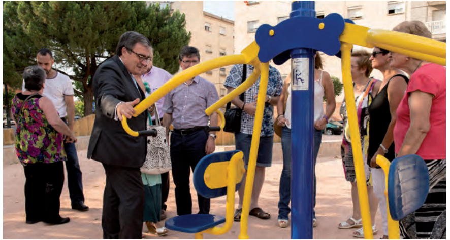
El barri disposa d'una nova plaça enjardinada i amb jocs esportius.

s'enjardinarà la zona amb la plantació d'arbrat nou. L'altra actuació, ja finalitzada, ha estat a la plaça Esplai, a la qual s'ha millorat l'enjardinament del parterre, s'ha ampliat la zona enjardinada delimitada amb taulons de fusta i s'han renovat tots els bancs. •••