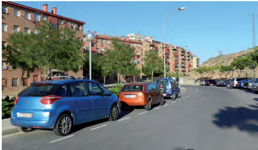
Noves places d'aparcament al carrer Cardenal Cisneros.

• Per a motos i cotxes que es concentren a diferents trams del barri