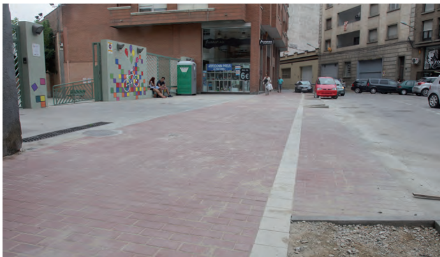
L'accés al Col·legi Sagrada Família és més segur.

També s'ha refet i s'ha ampliat la part de la vorera de davant del col·legi Sagrada Família amb un paviment de llamborda de color teula, que optimitza l'accés al centre educatiu. L'actuació urbanística inclou la instal·lació de mobiliari urbà i també la plantació de cinc arbres nous amb reg (al novem-