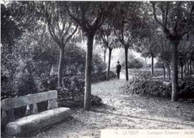
Entre 1864 i la Guerra Civil els Camps Elisis van constituir el gran espai de trobada social a l'aire lliure de la ciutat.