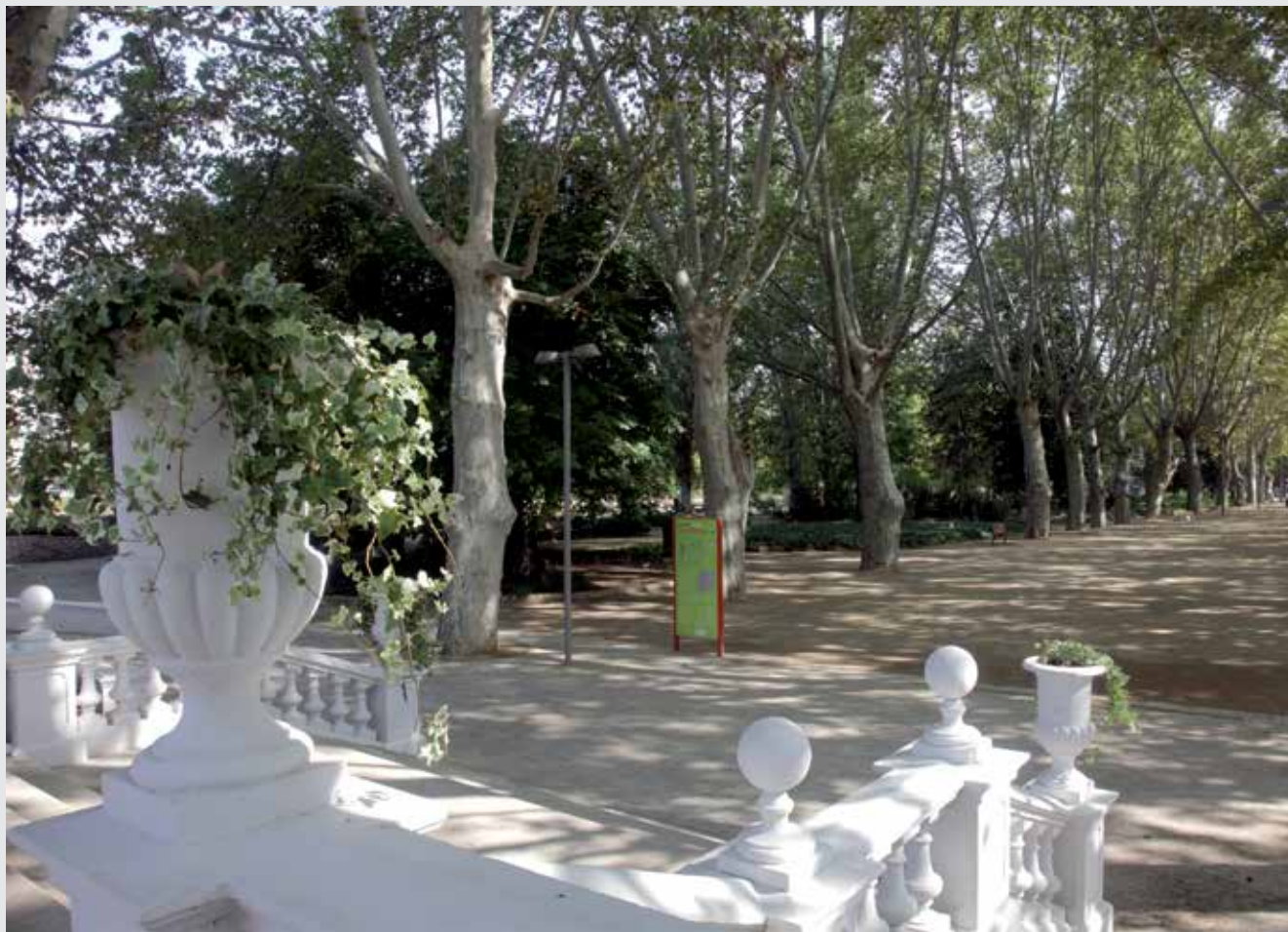
El recinte compagina avui dia el rol de zona verda i de lleure apta també per a actes festius amb els usos econòmics (celebració de fires) .