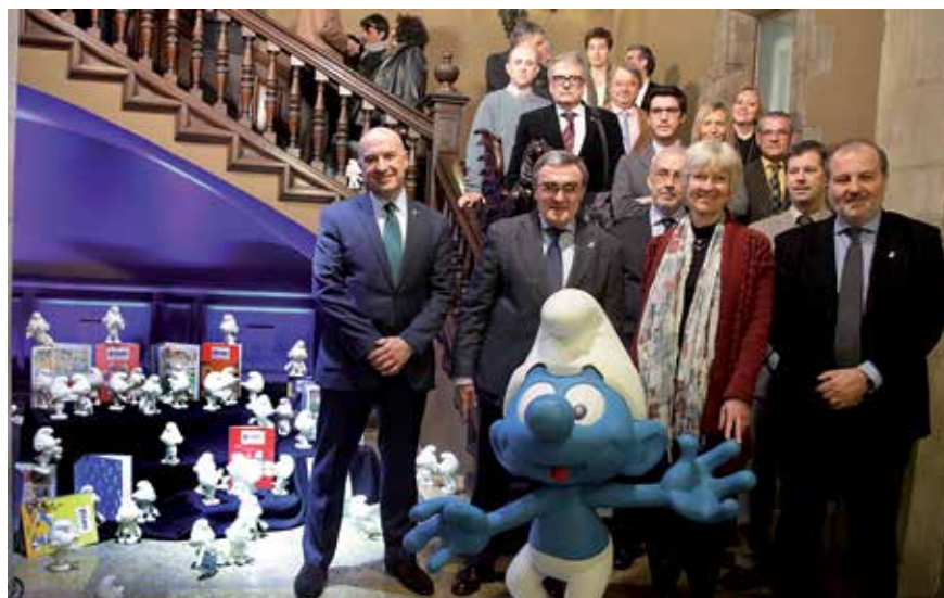
El paer en cap, el cap de l'oposició i diversos regidors amb representants d'IMPS i Biplano.