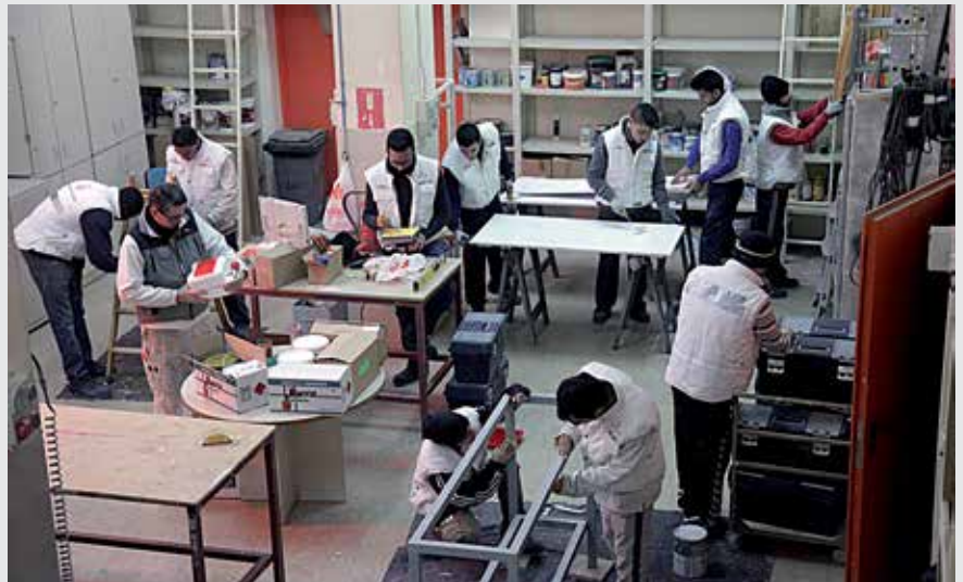
Taller de formació a la seu de l’Institut Municipal d’Ocupació.

Lleida és una ciutat clarament educadora, un fet que s’evidencia amb les divuit escoles bressol municipals i els tres centres d’estudis artístics (l’Escola d’Art Municipal Leandre Cristòfol, el Conservatori i l’Escola de Música i l’Aula de Teatre). Va anunciar que, aquest mateix mes de març, Lleida inaugurarà el Centre de Producció d’Arts Escèniques al Turó de Gardeny, que se suma a l’àmplia varietat de centres i estudis artístics que ofereix la ciutat de Lleida. I, encara sobre educació, va destacar que segueix l’aposta per impulsar la Forma-