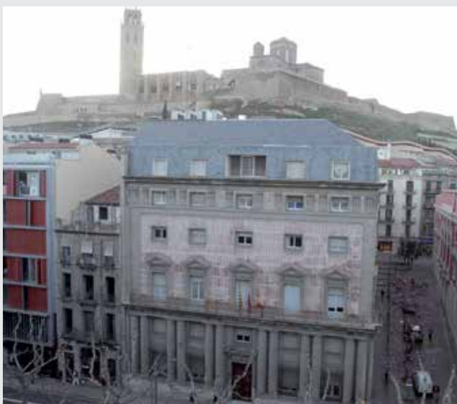
El Museu Morera es traslladarà a l’antiga Audiència.