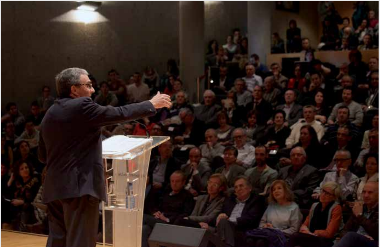
Durant la conferència, el paer en cap va repassar l'actualitat del temes més importants per a la ciutat.