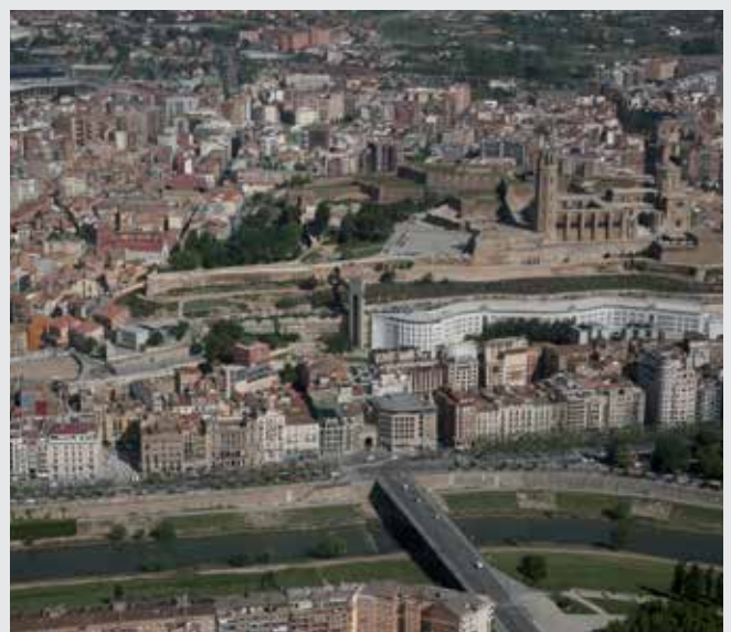
El POUM estableix les pautes del creixement de Lleida.