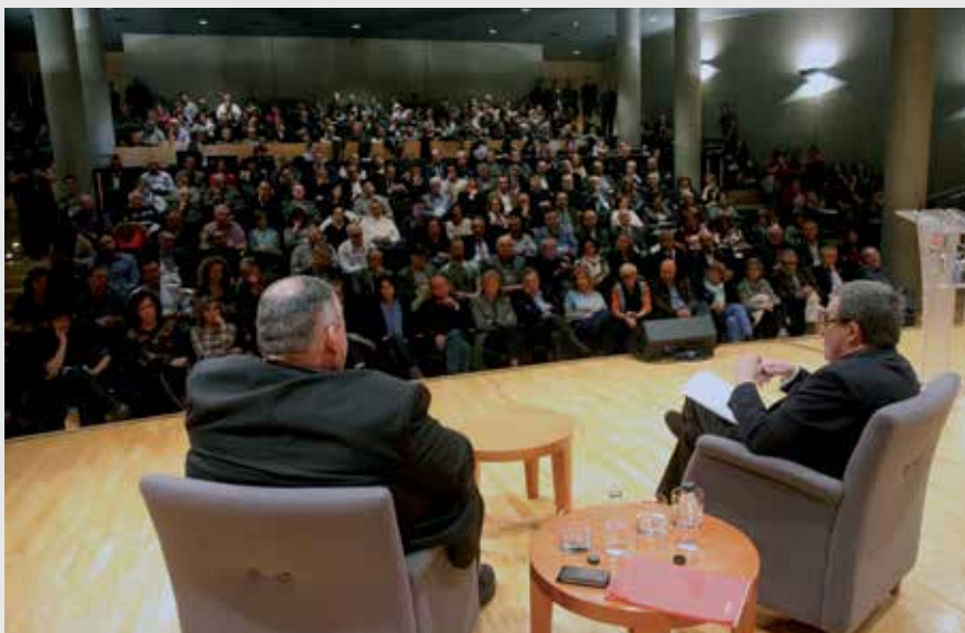
Auditori Enric Granados es va omplir de gom a gom per escoltar el paer en cap.

En la seva allocució va assenyalar que "la ciutat va perdre la revolució industrial, però que ara, a l'inici del segle XXI, no hem perdut la revolució del coneixement". Per l'alcalde de Lleida, "la indústria que volem per Lleida treballa en la recerca i l'esperit d'innovació que emergeix del Parc Científic i Tecnològic, de la Universitat i el seu capital humà i dels centres de Formació Professional". També va posar de manifest que "la relació intensa entre la universitat, l'empresa i l'administració és fonamental per al progrés del territori".