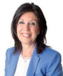
Dolors López Aguilar Lleida (1958). Llicenciada en Dret. Presidenta del PP de Lleida i diputada al Parlament de Catalunya i presidenta de la Comissió d'Infància.