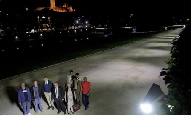
La Paeria ha ampliat la zona il·luminada de la canalització.