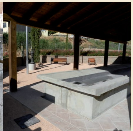
Imatges dels rentadors durant i després de la restauració.

Situada a l'accés del barri pel carrer Almeria