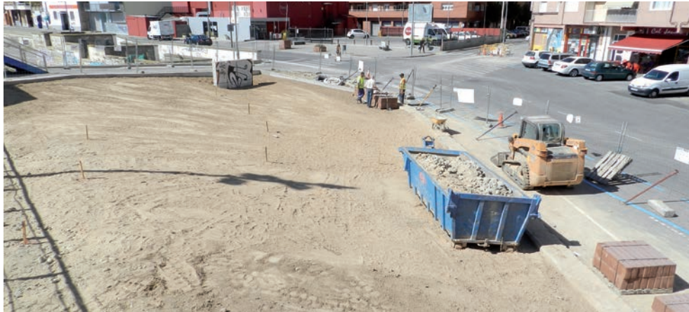
Els treballs de neteja del solar estan finalitzats.

◦ El solar adjacent al carrer Roger de Llúria s'enjardinarà i s'obrirà al públic