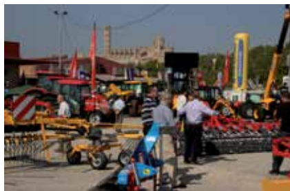
Imatge de l'edició passada.

E ls drones tindran un espai propi a la Fira Agrària de Sant Miquel i Eurofruit, salons que tindran lloc del 24 al 27 de setembre a Lleida. El saló aplegarà concretament una zona d'exposició, un espai de vols i unes jornades centrades els drones. A més de les interessants jornades tècniques, el visitant trobarà enguany una fira plena d'atractius i novetats, amb una gran oferta de maquinària agrícola i pesant i d'empreses