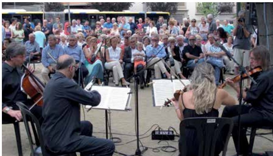
Havel Quartet va oferir un concert de música clàssica i popular catalana.

Gran zona de jocs infantils i més arbres i plantes arbustives