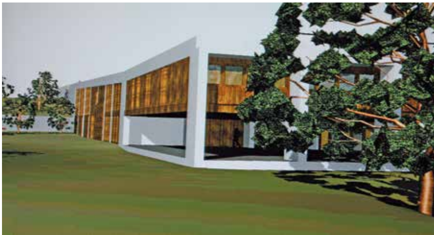
Es destinen 1,2 milions a equipaments municipals, com el Museu de la Ciència. © m2arquitectura

◦ Un vial entre la Bordeta i els Magraners, entre les més destacades