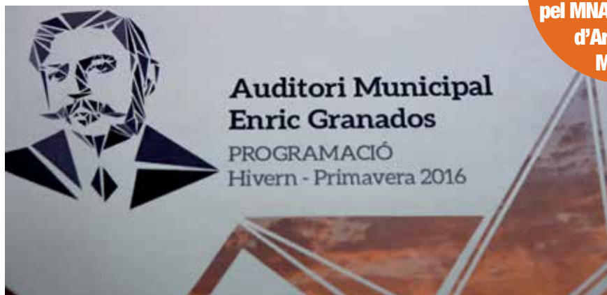
La programació de l'Auditori Municipal inclou concerts d'homenatge a Granados, que s'estendran a altres ciutats del món.