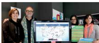
Projecte perquè els joves comparteixin.

Un taulell d'anuncis interactiu, per mitjà del web palmintercanvis.cat, servirà de plataforma per oferir i buscar serveis en quatre grans àrees diferenciades, que són habitatge, petites feines, intercanvi i compravenda de material divers.