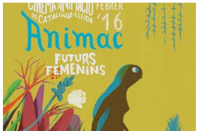
Cartell de la 20a edició de l'Animac. © Carles Porta