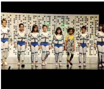
Companyia infantil de l'Aula de Teatre.

◦ Iniciativa de l'Aula Municipal de Teatre per fomentar la sensibilització artística vers la cultura