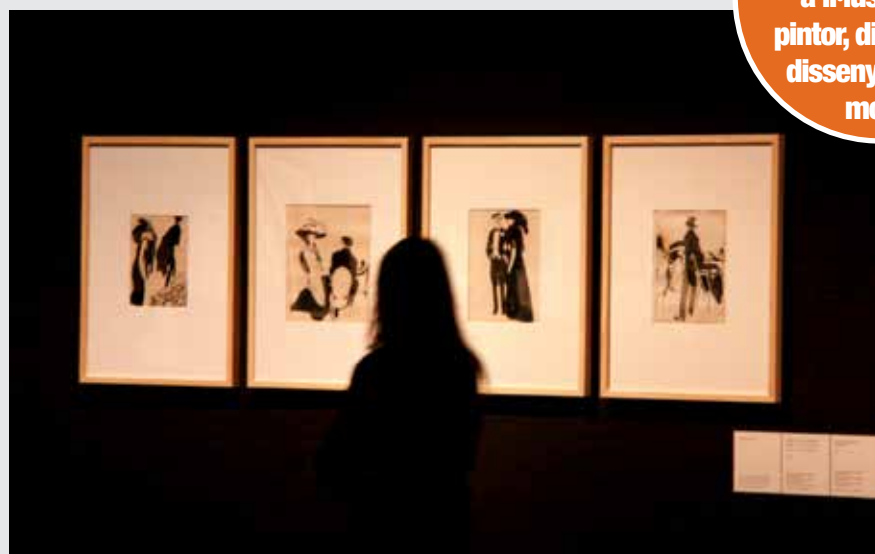
Es mostren 300 creacions de l'artista, entre pintures, dibuixos, revistes i il·lustracions.

Mostra de l'artista lleidatà com a il·lustrador, pintor, dibuixant i dissenyador de moda