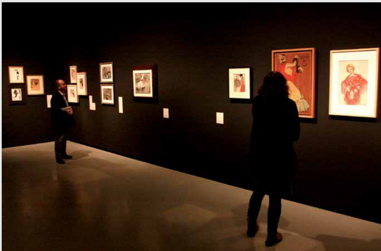
Els visitants poden veure l'exposició més completa feta mai sobre el llegat de l'artista lleidatà.