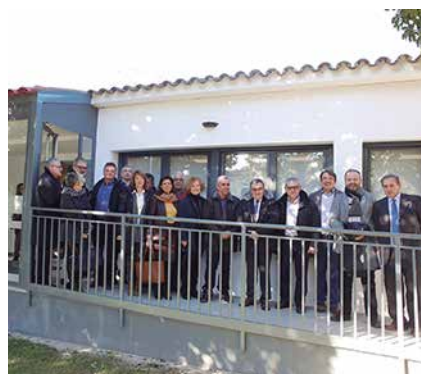
Les autoritats visitant la instal·lació.

L'alcalde de Lleida, Àngel Ros, va destacar que "tot poble i ciutat necessita dife-