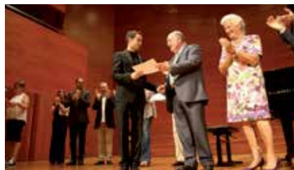
El guanyador del concurs de piano.