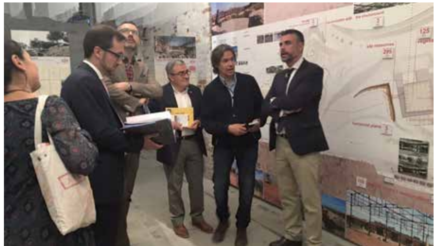
L'alcalde de Lleida i el conseller de Cultura, Santi Vila, a l'estand de Toni Gironès.

Destaca la pèrgola de 900 metres quadrats, que acollirà 24 plantes enfiladisses