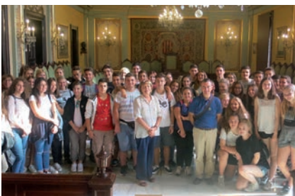
Recepció a alumnes europeus.

◦ L'Ajuntament està acreditat per la Comissió Europea