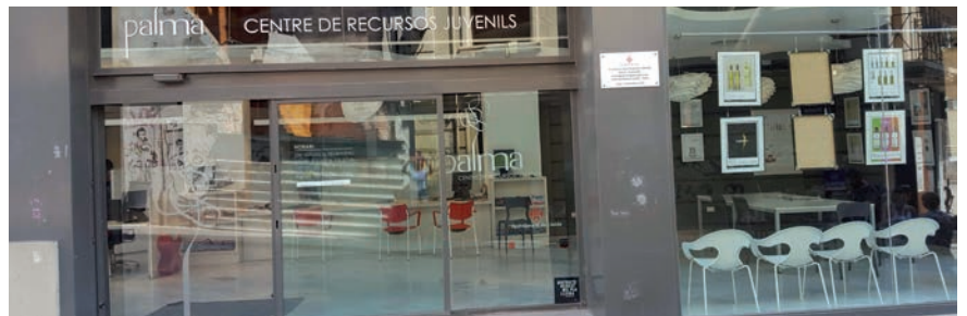
Local del Centre de Recursos Juvenils de la Paeria al carrer la Palma.

La Palma - Centre de Recursos Juvenils Tel. 973 70 06 66