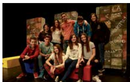
Teatre per prevenir drogodependències.

◦ Celebració del 25è aniversari dels programes en pro dels hàbits saludables i en contra de les drogodependències