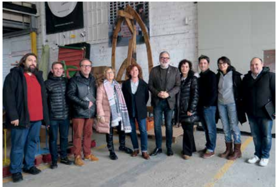
Presentació del pla de promoció i internacionalització de les empreses culturals.

La nova estratègia municipal per potenciar i promocionar internacionalment les petites i mitjanes empreses culturals de Lleida haurà de seguir les directrius fixades pel Pla Estratègic de Cultura de la Ciutat de Lleida, aprovat fa uns mesos, i el Pla de Promoció de la Ciutat de