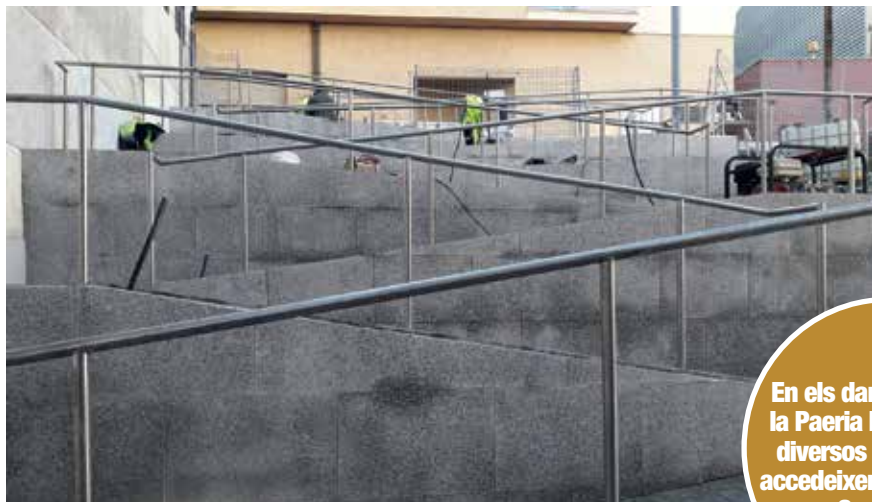
Rampa en ziga-zaga que salva el desnivell de quatre metres del vial.

◦ L'actuació urbanística ha consistit en l'habilitació d'una rampa per permetre l'accés de cadires de rodes i cotxets infantils