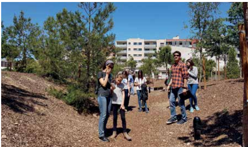
El bosc urbà de Cappont, inaugurat el 2016, va ser el primer a construir-se a la ciutat.