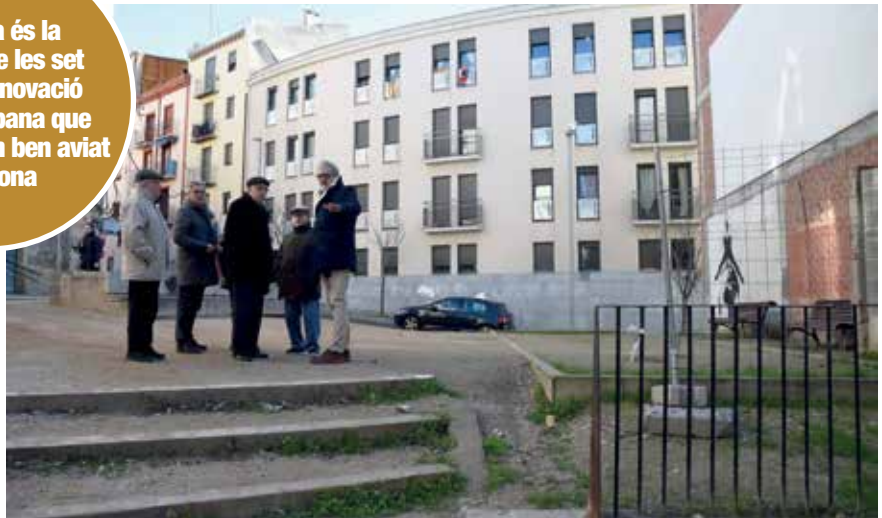
L'alcalde i representants veïnals visiten l'espai en què es construirà el bloc de pisos.