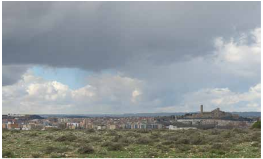
Les vistes de la ciutat que es podran contemplar des del bosc urbà de Magraners.