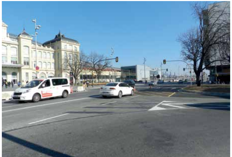
El carrer Príncep de Viana ha guanyat un carril de circulació.

Per fer aquests canvis ha estat necessari trasplantar dos grans castanyers d'índies