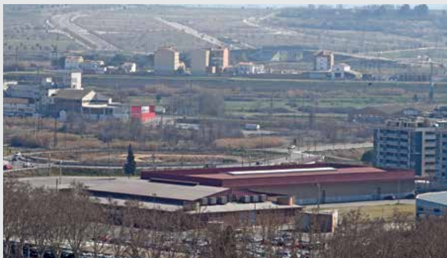
Vista aèria del recinte firal lleidatà i de la zona de Torre Salses.

Respecte al vistiplau al nou POUM, el paer en cap va dir que “la comissió avala els grans temes plantejats, ens compra el