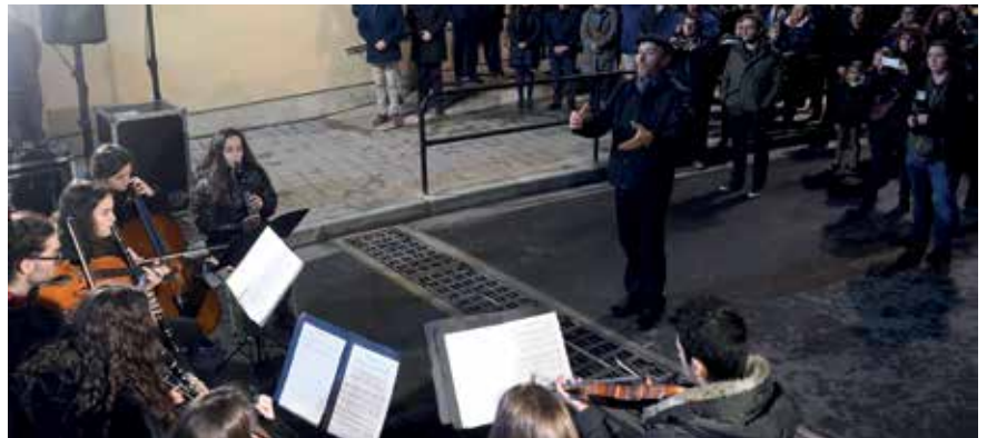
Actuació dels quartets de corda i de clarinets de l'Orfeó durant l'estrena del carrer.

◦ Davant de l'IMO, a la falda del Turó de la Seu Vella i a la urbanització de la Cerdera