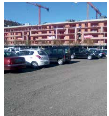
El pàrquing ja remodelat.

Amb aquesta intervenció, es millora la seguretat i el confort d'una zona molt utilitzada pels veïns i les veïnes i també per les persones que es desplacen amb cotxe al centre de Lleida des de fora de la ciutat per treballar o fer les compres a l'Eix Comercial i els voltants.