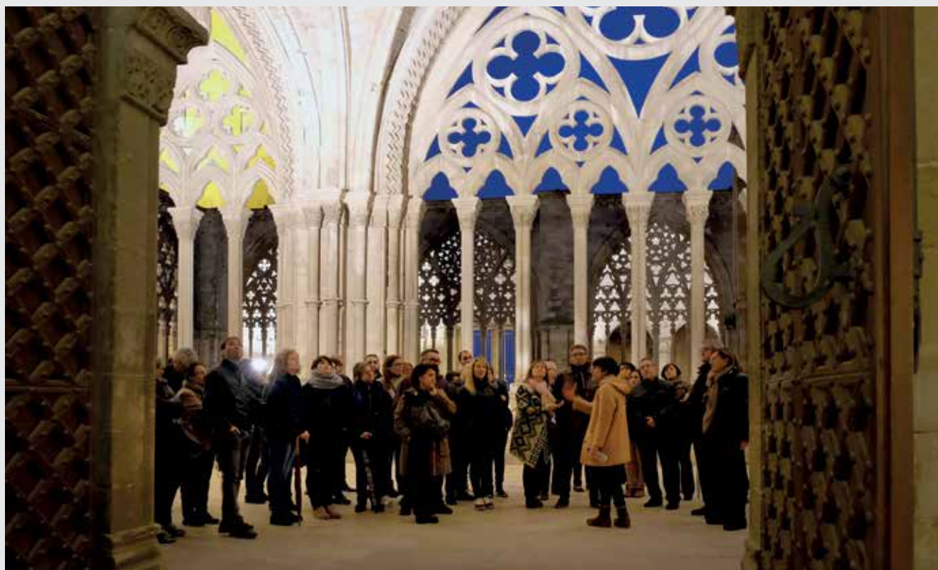
El POUM inclou l'impuls al patrimoni amb el Pla especial del Turó de la Seu Vella.

d'oportunitats, amb dinamisme comercial, capitalitat cultural i lideratge socioeconòmic. Una Lleida més capital i central per les seves infraestructures de comunicacions que aposta per valors de gènere i ambientals", va destacar el paer en cap.