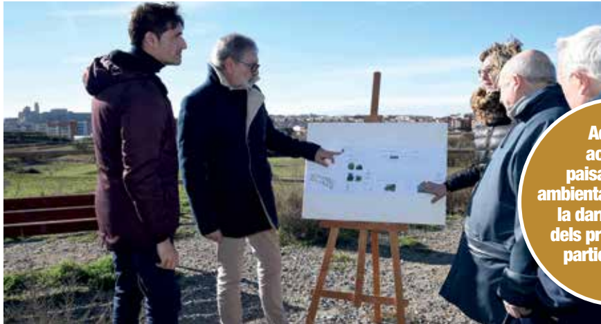
Visita del paer en cap a un dels dos miradors del Secà de Sant Pere.

• Cadascuna de les talaies es dividirà en dues àrees diferenciades, una d'arbrada i una altra on hi haurà espais de lleure i descans