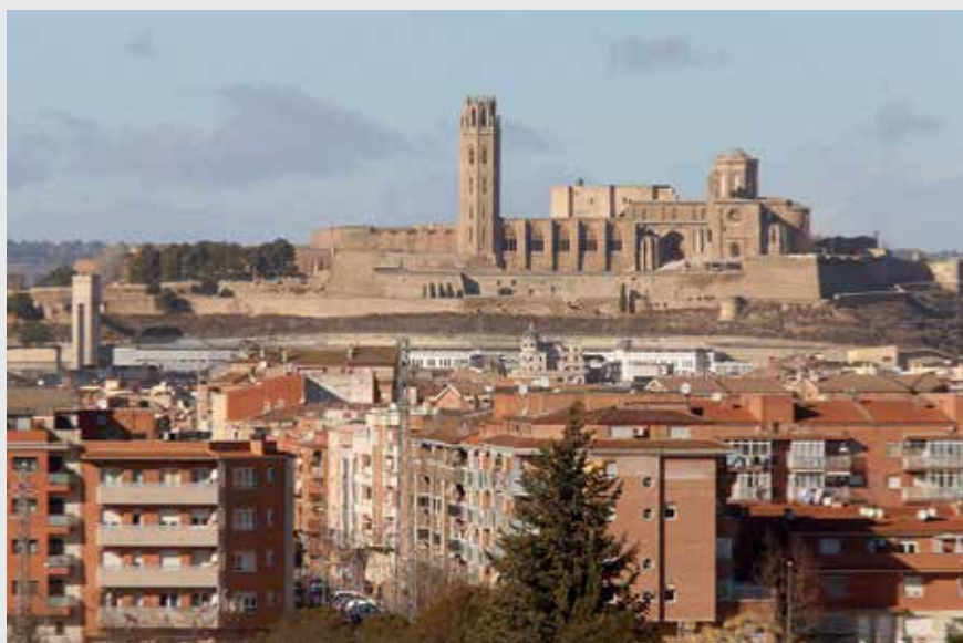
El nou POUM es caracteritza per l'aposta per la contenció del creixement urbanístic.

“És un POUM que permetrà situar Lleida d'aquí a 15 o 20 anys com una ciutat