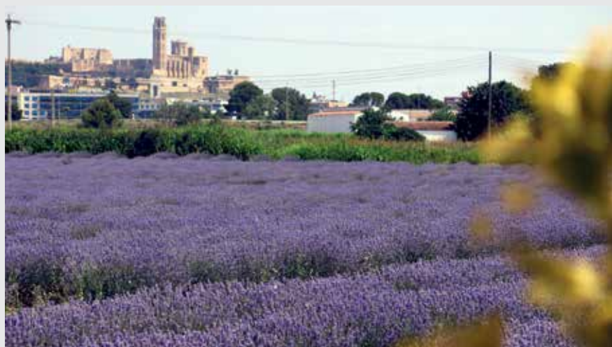
L'Horta, un espai singular a consolidar per potenciar l'activitat agrària.