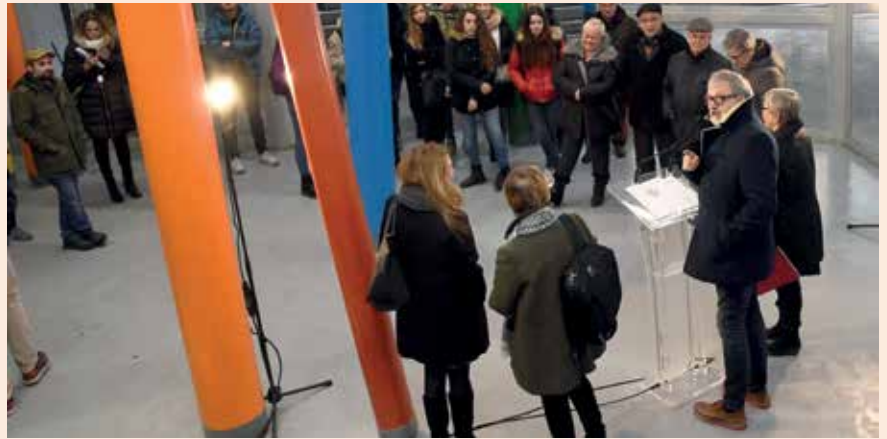
Instal·lacions de la Casa del Dibuix, situada al carrer Cavallers.

El Consell Municipal de Cultura de Lleida s'ha reactivat amb la voluntat de fer pinya per la cultura de Lleida, generar pensament, aportar idees, crear debat i fer propostes i, en definitiva, fer un sector cultural més fort, més dinàmic i més internacional. És integrat per 84 persones representants d'entitats culturals, professionals, creadors, empreses i administracions. La recuperació del Consell Municipal de Cultura forma part