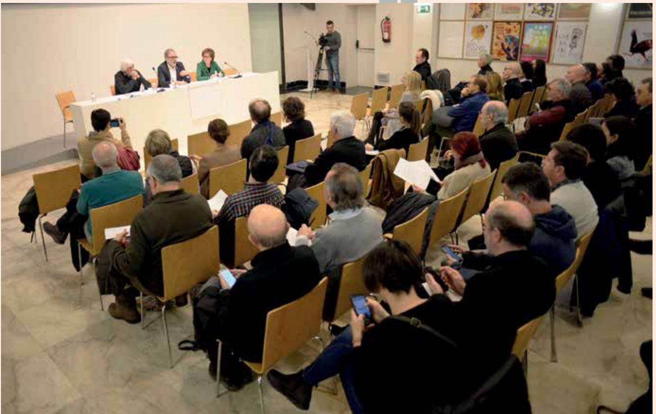
El Consell Municipal de Cultura, que es va constituir el 30 de gener, és format per 84 persones.

ha tingut com a tema principal el món de l'animació stop motion. Enguany, el britànic Peter Lord, director i cofundador de l'oscaritzat estudi d'animació stop motion Aardman Animations, conegut mundialment per "Wallace & Gromit" i "El Xai Shaun" i per llargmetratges familiars de culte com "Chicken Run" (2000) o "Pirates!" (2012), ha rebut el Premi d'Honor d'Animac. El premi Trajectòria ha recaigut en el tàndem format pel