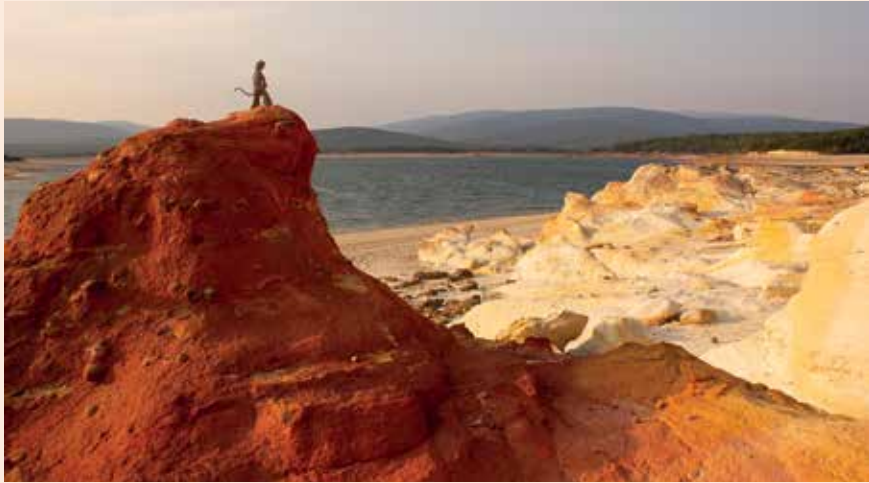
"Muedra", curtmetratge de César Díaz que s'ha projectat a l'Animac.

cionals com Kacy & Clayton, WITCH (We Intend To Cause Havoc), Ouzo Bazooka, The Parson Red Heads i Conjunto Papa Upa. S'hi sumen els estatals Depedro i Daniel Lumbreras, per formar, de nou, un cartell excitant i sorprenent. Els concerts d'aquesta edició es podran assaborir al Cafè del Teatre de l'Escorxador, i el concert íntim (dia 9, amb entrada lliure), a la botiga-cerveseria Grans Records de Lleida. ●●●