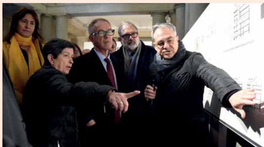
L'arquitecte municipal explica el projecte del museu a les autoritats.

La Casa del Dibuix, al carrer Cavallers, inicia la seva activitat