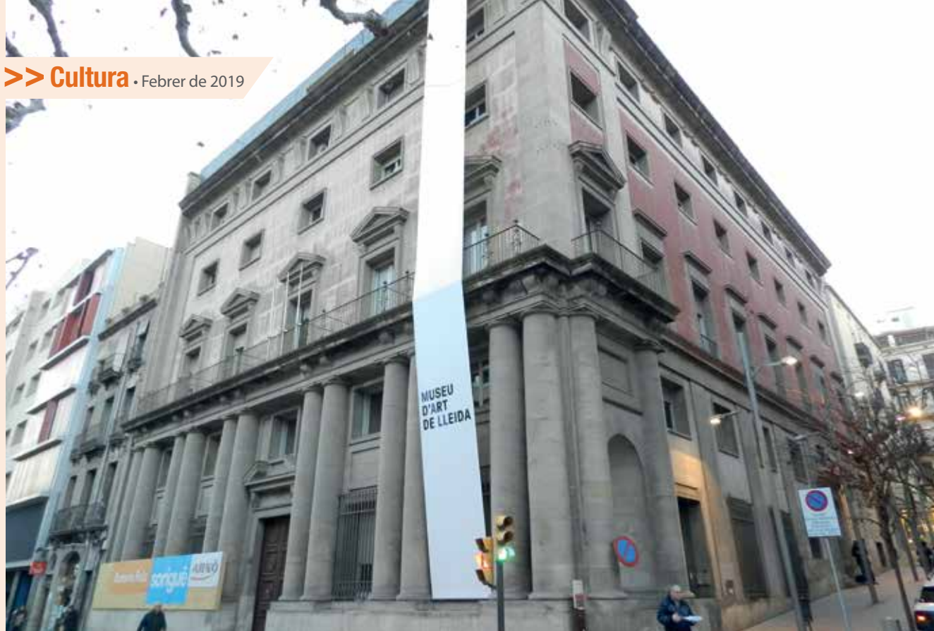
L'antic edifici de l'Audiència de la rambla de Ferran acollirà el futur Museu d'Art de Lleida.