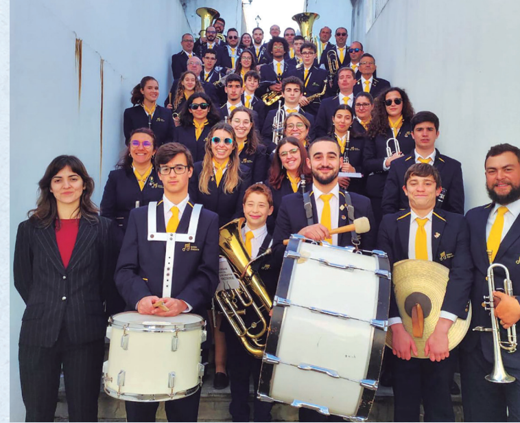
Sociedade Musical e Recreativa Obidense, Portugal