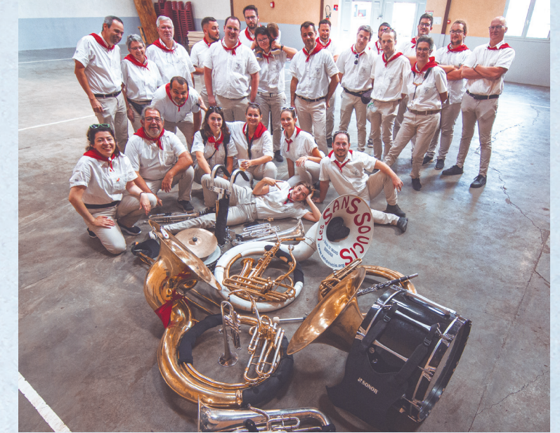
Les Sans Soucis de Bordeaux, França