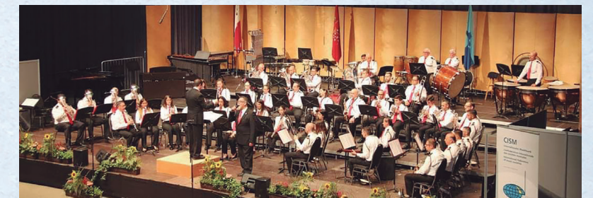
Socjeta Muzikali Santa Katarina VM, Malta