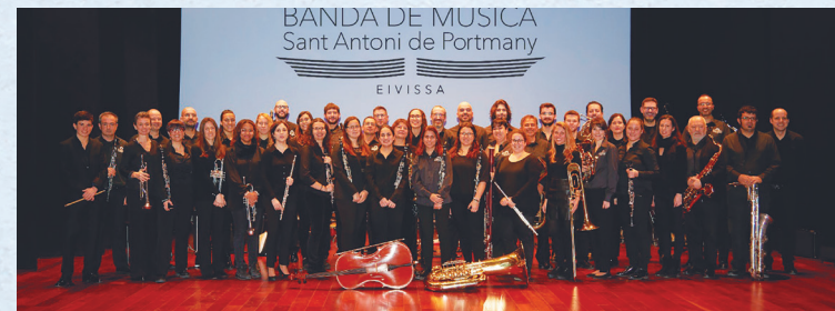
Banda de Música Sant Antoni de Portmany, Illes Balears

21.00 h Església Nova • Banda de Música Sant Antoni de Portmany Illes Balears