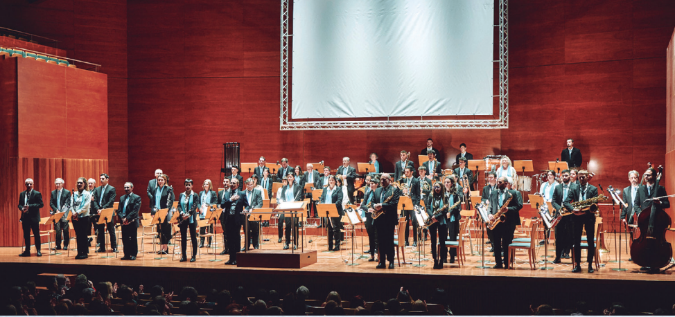
Banda Municipal de Lleida