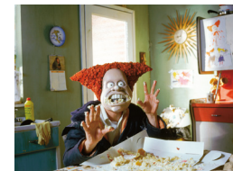
Retrospectiva Aardman. Angry Kid

Totes les sessions estan limitades a l'aforament de les sales.