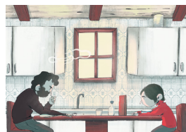
Curts 2. Soy una tumba

17.30 h CaixaForum Curts 3 Selecció de perles animades. CURTS. TOTS ELS PÚBLICS