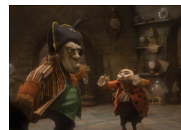
Monogràfic stop motion 3: Hoffmaniada

20.30 h La Llotja, Sala 1 Monogràfic stop motion 3: Hoffmaniada L'univers d'E. T. A. Hoffmann amb titelles animats! VOS (rus). LLARG. +16