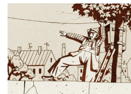
Curts 1. Elektrica diena

D'11 h a 14 h La Llotja, Sala Martina Castells Animacrea Tallers d'animació amb mil tècniques i estils. Entrada gratuïta. MULTIDISCIPLINARI. TOTS ELS PÚBLICS