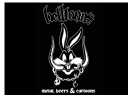
Animac de nit. Helltoons

Cafè del Teatre. C. Roca Llaurador, 2 bis (de 19 h a 2 h). La Casa de la Bomba. C. Camp de Mart, 31 (de 19 h a 3 h).