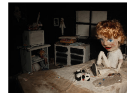
Monogràfic stop motion 1: La casa lobo