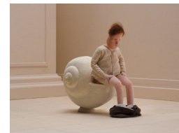
Monogràfic stop motion 5. This Magnificent Cake

SESSIONS +0, +3, +6, +8, +12, +16, +18. Sessions recomanades per franja d'edat, per comprensió del contingut.