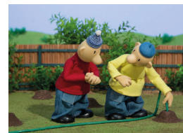
Petit Animac 7 i 8. Pat i Mat

D'11 h a 14 h La Llotja, Sala Martina Castells Animacrea Tallers i activitats dinàmiques per viure l'animació en primera persona. Entrada gratuïta. MULTIDISCIPLINARI. TOTS ELS PÚBLICS