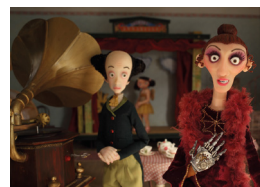
Petit Animac 5. Captain Morten and the Spider Q.

00 h La Casa de la Bomba Animac de nit. Animac és la bomba Mentre el cos aguanti. Bar musical oficial Animac. Entrada gratuïta. MÚSICA. +18