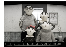
Curts 3. Sister

De 17 h a 19 h La Llotja, Sala Martina Castells Animacrea Tallers i activitats dinàmiques per mostrar tècniques i viure-les en primera persona. Entrada gratuïta. MULTIDISCIPLINARI. TOTS ELS PÚBLICS