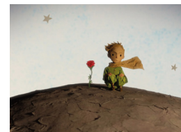
Mark Osborne: The Little Prince

12.30 h CaixaForum Petit Animac 2. Imaginació al poder! Històries d'animals, somnis i una Caputxeta Vermella ballarina. CURTS. INFANTIL. +3