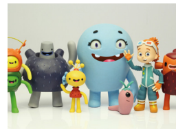
Conferències. El diari de Bita i Cora

L'espai amb més color d'Animac. Tallers de totes les tècniques animades, projeccions, mercat animat i més. Entrada gratuïta. MULTIDISCIPLINARI. TOTS ELS PÚBLICS