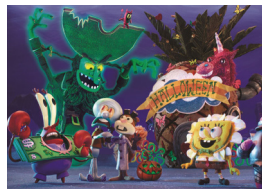
SpongeBob SquarePants: The Legend of Boo-Kini Bottom

BOB ESPONJA. LA PEL·LÍCULA Stephen Hillenburg i Mark Osborne, Estats Units, 1 h 23', 2014