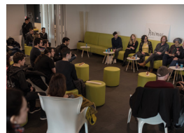
Esmorzar amb les autores i els autors

00 h La Casa de la Bomba Animac de nit. Animac és la bomba Bar musical oficial d'Animac. Entrada gratuïta. MÚSICA. +18