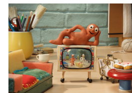
Open Screen. Retrospectiva Aardman. Morph

16 h La Llotja, Sala 1 Retrospectiva Aardman 3: ¡Piratas! Una colla de pirates inadaptats i el seu capità inexperimentat volen guanyar el concurs del Millor pirata de l'any. VOS (anglès). LLARG. TOTS ELS PÚBLICS