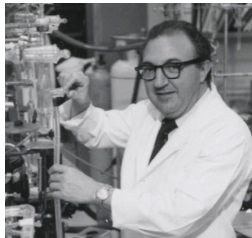
Imatge del documental "Joan Oró. La fórmula de la vida" produït per la Fundació la Caixa

El fil conductor que s'ha triat enguany per al festival és la figura del bioquímic lleidatà Joan Oró, amb motiu de la commemoració del centenari del seu naixement. Així, diverses activitats de l'INTANGIBLE giraran al voltant de la seva figura com per exemple el documental, produït per la Fundació la Caixa, "Joan Oró La fórmula de la vida", al CaixaForum, que anirà precedit d'un col·loqui amb Pau Subirós, realitzador del documental, i Joan Català, comissari de l'Any Oró.