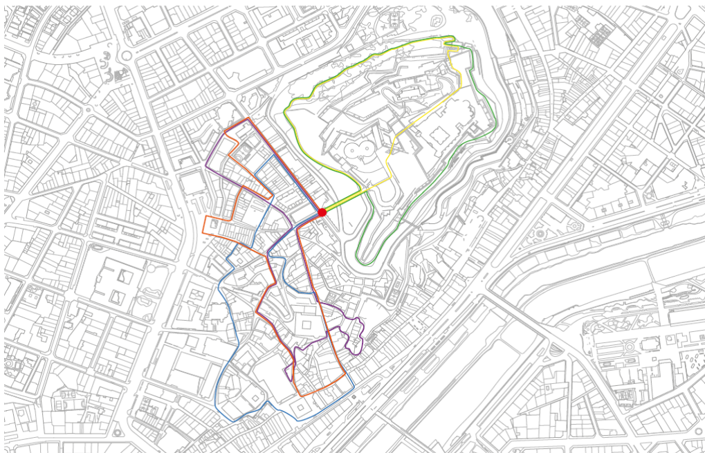
Plànol 2. Itinerari modificat de les cinc rutes saludables